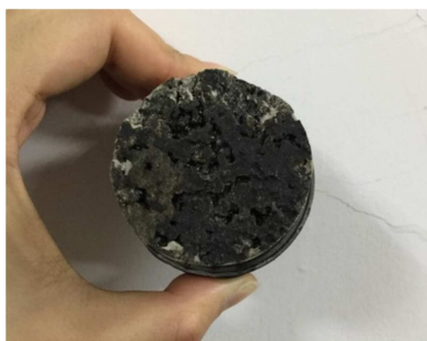
图2 60°C时粘结层破坏断面。

对于沥青混合料层间粘结的试件,可以发现23°C试验时,抗拉强度均大于3MPa,且此时破坏为接头破坏,理论上粘结层的粘结强度应大于测得的粘结强度数据[13]。在60°C材料粘结强度大幅下降的情况下,只对比粘结层破坏的试件,则两种混合比的试件粘结强度差异并不大,且存在试件发生了在沥青混合料中的断裂情况[14]。可以基本认定,在高温条件下粘结料普遍粘结性能较好,混合比对其影响并不大。