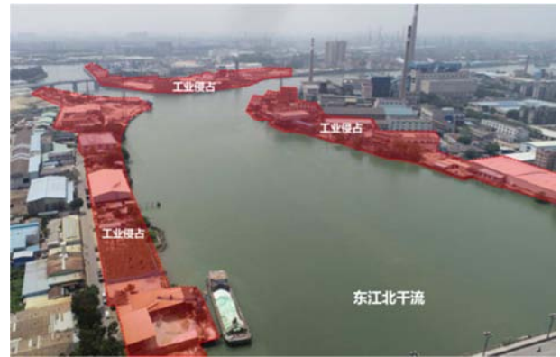
图3 河涌水系被工业侵占示意图。

破。部分工业区色彩突兀,与周边不协调,建筑形态独特导致整体工业肌理出现偏差,缺乏滨水岸线整体性。