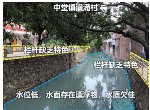
图4 水乡聚落滨水问题示意图。

滨水区聚落生态环境破坏。几乎每个东莞水乡的聚落都或多或少存在环境污染的问题,在工业化、城镇化程度较高的聚落尤为突出。