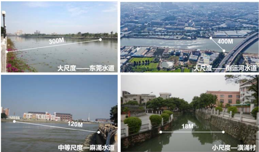
图1 不同尺度水道示意图。

汇总二十年内数据,得出河道变化趋势。总体而言,水乡功能区内河宽趋于稳定,河道下切趋势减缓。大部分河段呈现下切趋势,近年来下切情况有所缓解,但部分河段下切仍比较严重。