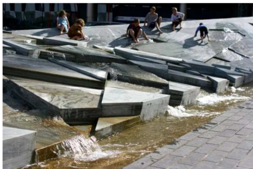
图2 广场叠水景观 2 。