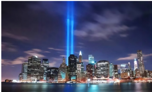
图8 广场辐射灯光 8 。