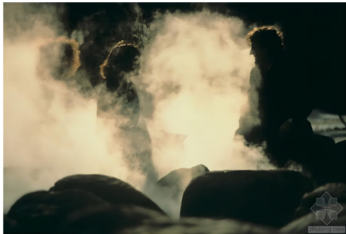
图6 喷泉中的水雾 6 。