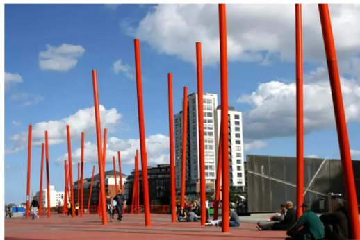
图1 广场红色灯柱 1 。

玛莎·施瓦茨的形象与建构语言，非常突出的表现出极简主义理念所具备的鲜明特征。都柏林大运河广场的景观形态简约凝练，设计元素丰富而统一，在总体上使用了对形态的明晰化、序列化、简约化的处理方法，从而产生了具有概括性且整体风格清晰明确的效果[8]。不难看出整个广场没有明确的空间围合感，但设计师运用材料、颜色、造型、植物等的差异化表达形成了鲜明的领域感。它以丰富的景观形态，反映了玛莎·施瓦茨的极简主义设计思想，富有一定的时代精神。