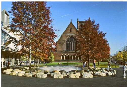
图5 唐纳喷泉 5 。

间的岩石排布会也比较紧密，共有三个喷嘴。在春夏秋三季喷出的水雾会如浮云一般模糊了岩石的棱角，将人包裹在一片飘渺的仙境之中（图6），同时白天和黑夜喷泉的呈现形式也大不相同，实现了一景可达四时之变。唐纳喷泉充分展示了彼得·沃克对极简主义运用技巧上的成熟[11]。喷泉中的水雾在功能上具有物质和精神的三重身份：作为一处水景吸引人们的视线，为使用者们营造飘然其中、云雾环迎的氛围感；精神上试图用喷泉的空间和天然石材的原始野性之美，打通人们与自然的交流渠道，使得公众可以真正的去体验自然、感知自然、与自然对话。