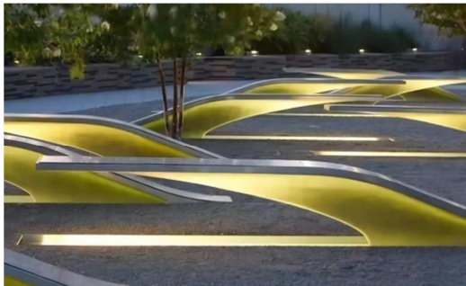
图9 广场座椅 9 。