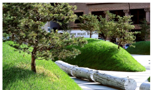
图4 广场原木座椅 4 。