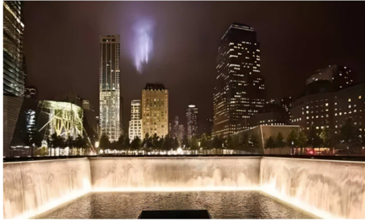
图7 下沉式跌水池 7 。

值得一提的还有场地中极富设计感的座椅（图9），该设计由KBASA工作室完成，座椅形态简约而不单调，与广场主题相契合。也是对极简主义艺术形式的一种诠释。两英亩的场地中包含有184个刻印着受害者姓名的长椅，每一个座椅下方都有一弯浅水，静谧又祥和。置于这氛围之中可冥思、可哀悼、可寄托忧愁与思念，亦如逝者就在身侧。