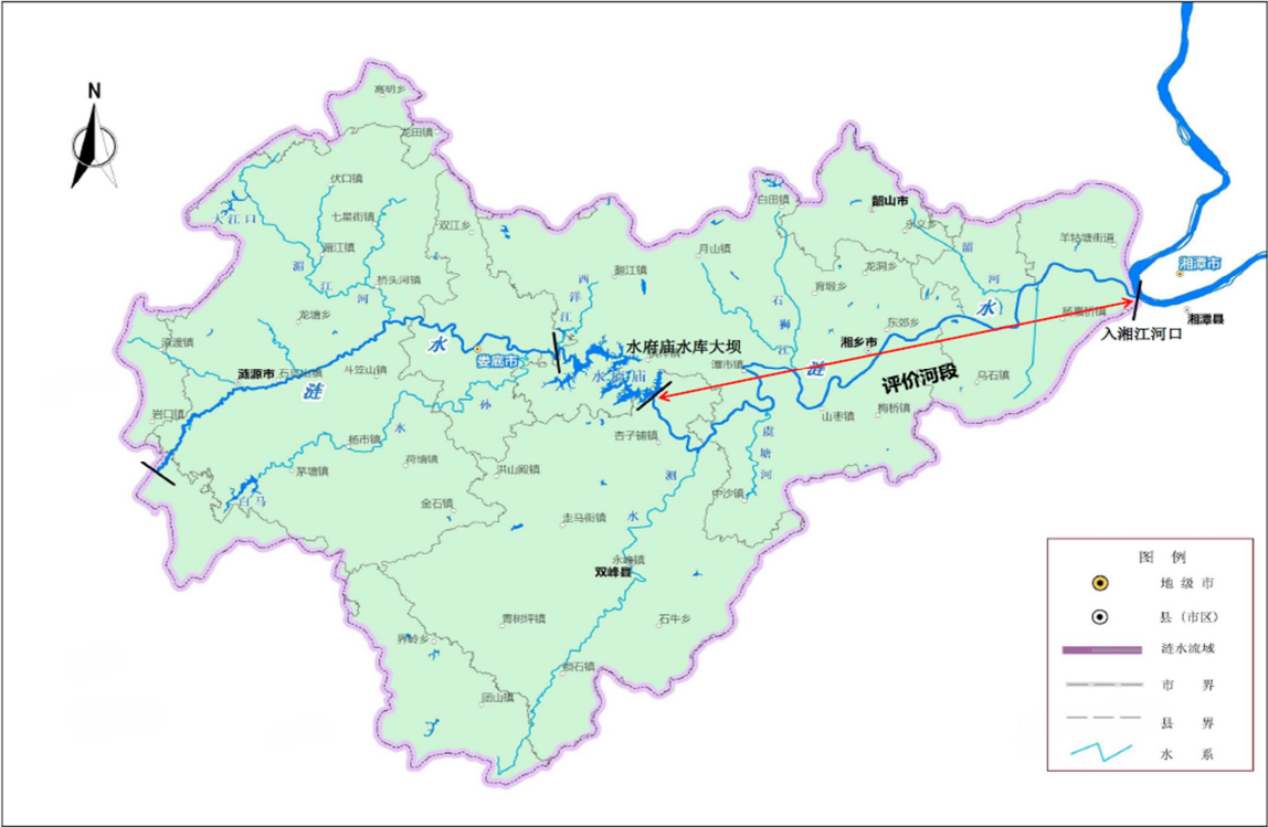
图1 评价河段地理位置图。

涟水干流全长224km，是湖南省内湘江左岸的一级支流，位于湘江下游，发源于新邵县观音山南麓，流经涟源市、娄星区、经济技术开发区，经济技术开发区梨头咀汇合孙水进入湘乡市境内注入水府庙水库，出水库后进入娄底市双峰县境内，出双峰县再次进入湘乡市范围，于湘潭县河口镇的东北部汇入湘江。考虑到评价河段不宜过长，且上下游水质状况、植被情况、社会经济发展等应无明显差异，加之水府庙库区水面面积较大，不适用于河流评价准则，故选取水府庙库区以下湘潭市境内长度113.7km河段作为河湖健康评价研究对象，评价范围如图1所示。