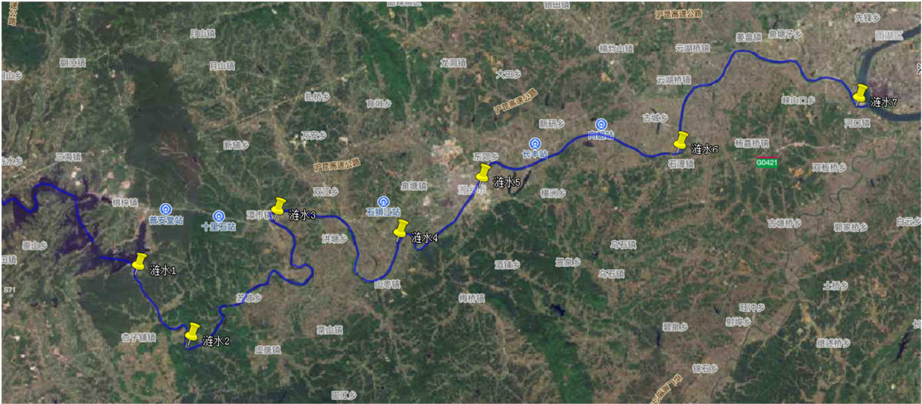
图2 评价河段监测断面布设位置图。

一策”（2018—2020年）实施评估》、《涟水（湘潭段）岸线保护与利用规划（2020—2035年）》、《湘潭市统计年鉴》、《湘潭市水资源公报》、2020年湘潭市地表水质量月报、2020年湖南省涟水干流“四乱”问题清单、湘乡站水文统计等资料。底泥污染、大型底栖无脊椎动物生物完整性指数、水生植物群落状况来源于监测数据，结合涟水干流的实际情况及各指标采样要求，依照典型性和代表性的原则布设7个采样监测断面，采样点位置如图2所示。